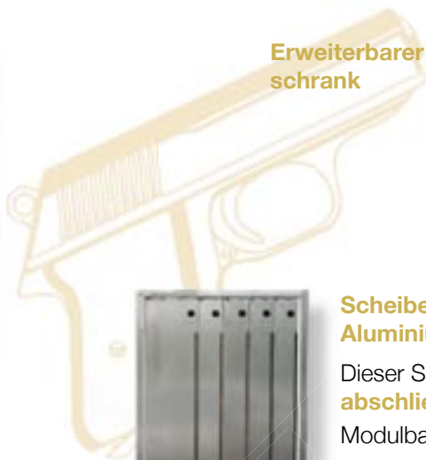
Scheibenschrank aus 2 mm Aluminium

Dieser Schrank ist einzel abschließbar und in einer Modulbauweise erstellt.